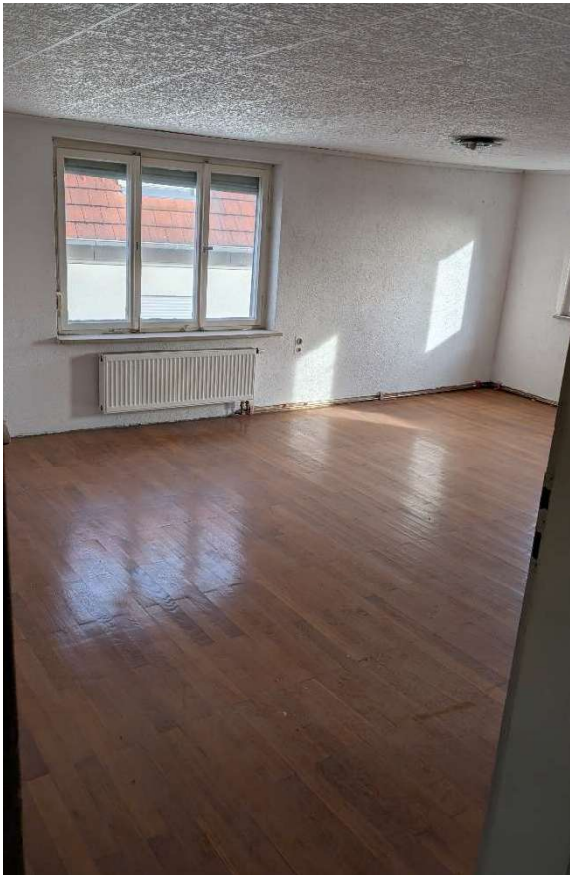
Zimmer 2. OG: