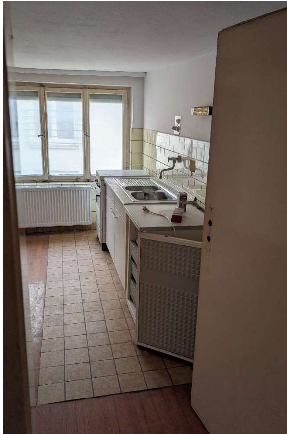
Küche 2. OG: